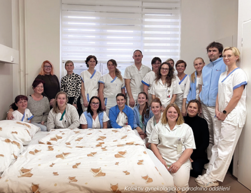
Kolektiv gynekologicko-porodního oddělení

Online objednávací portál https://e-health.msk.cz