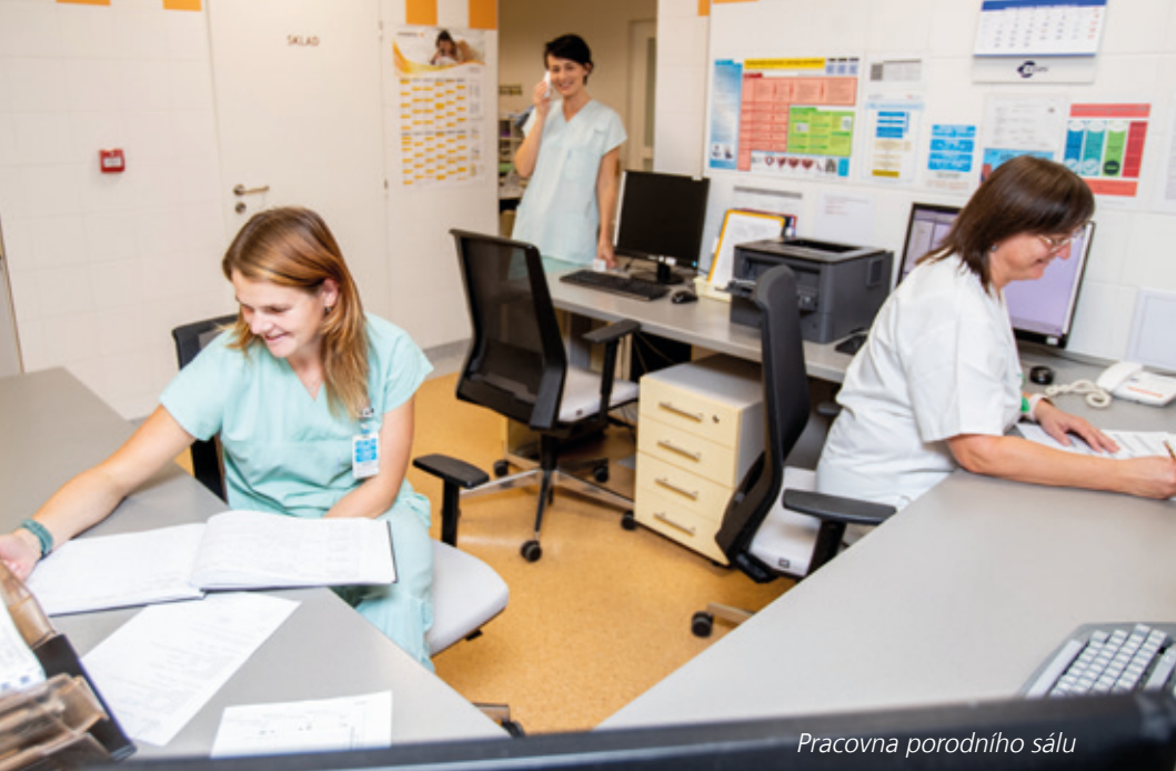
Pracovna porodního sálu