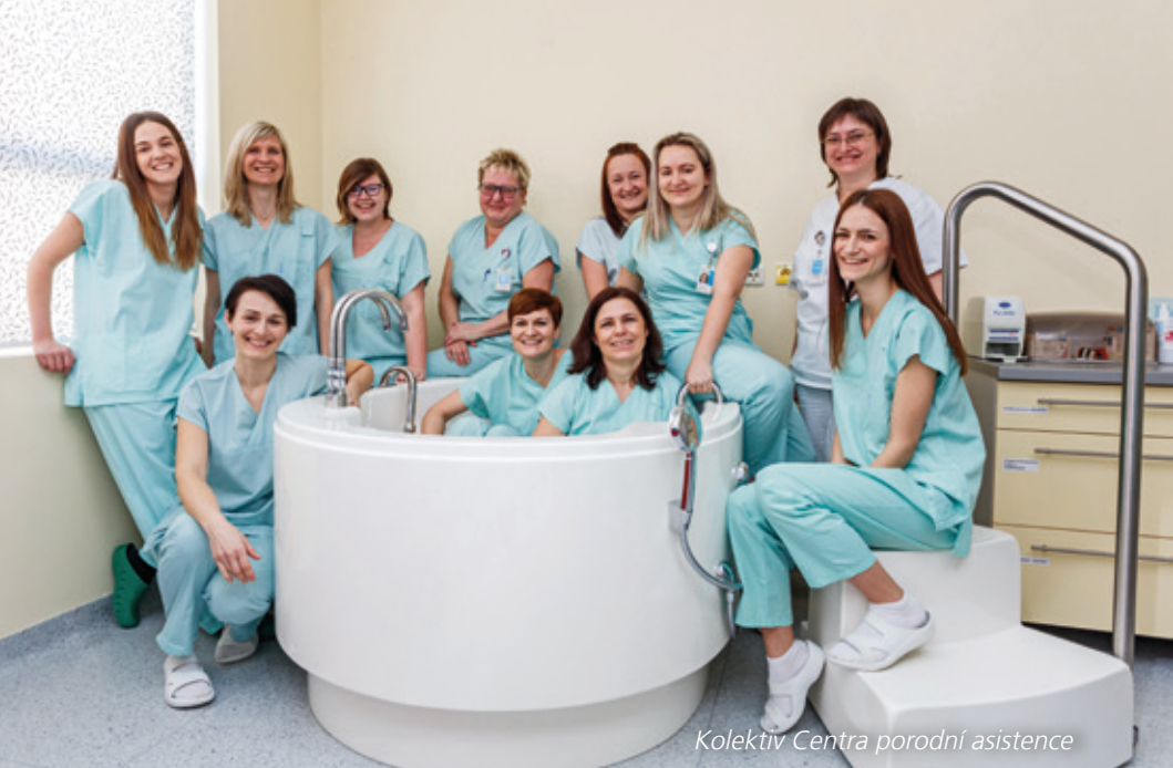
Kolektiv Centra porodní asistence