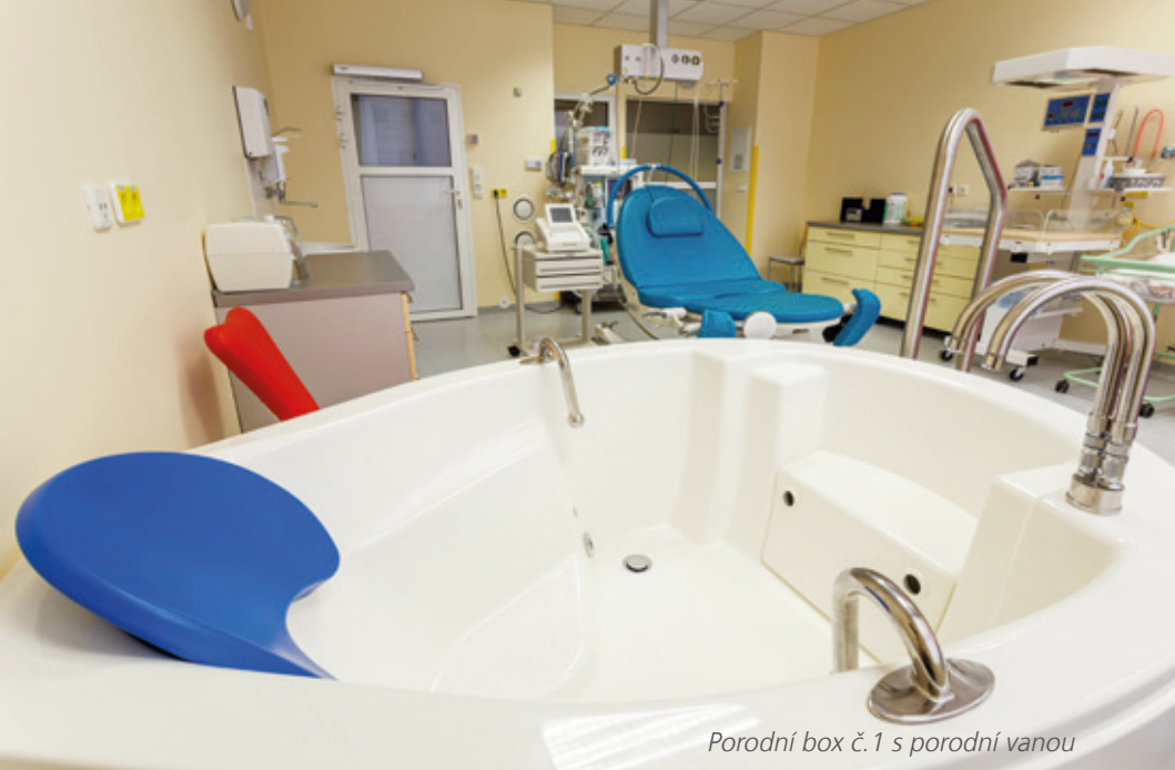
Porodní box č. 1 s porodní vanou