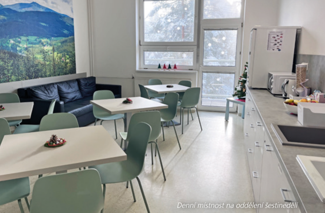
Denní místnost na oddělení šestinedělí