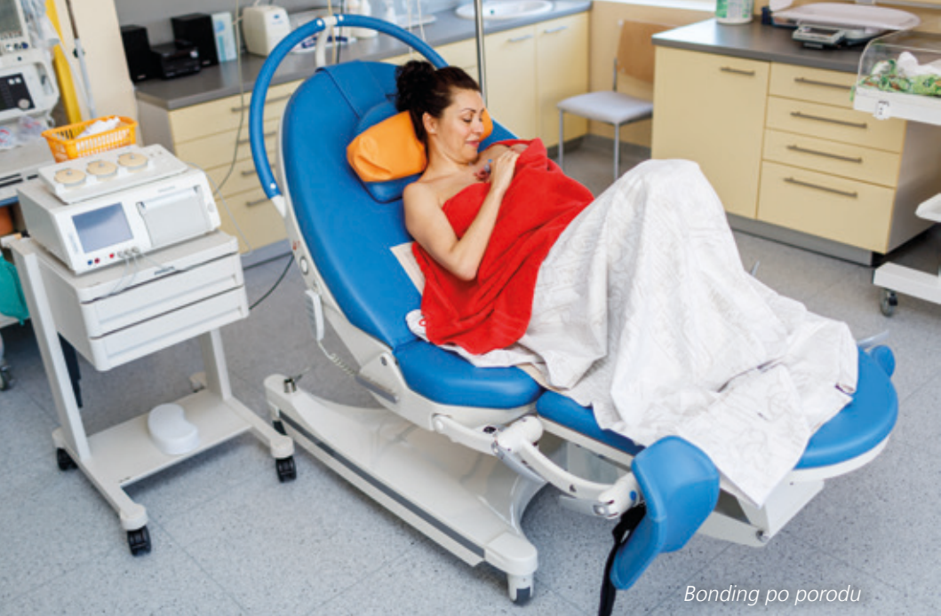
Bonding po porodu