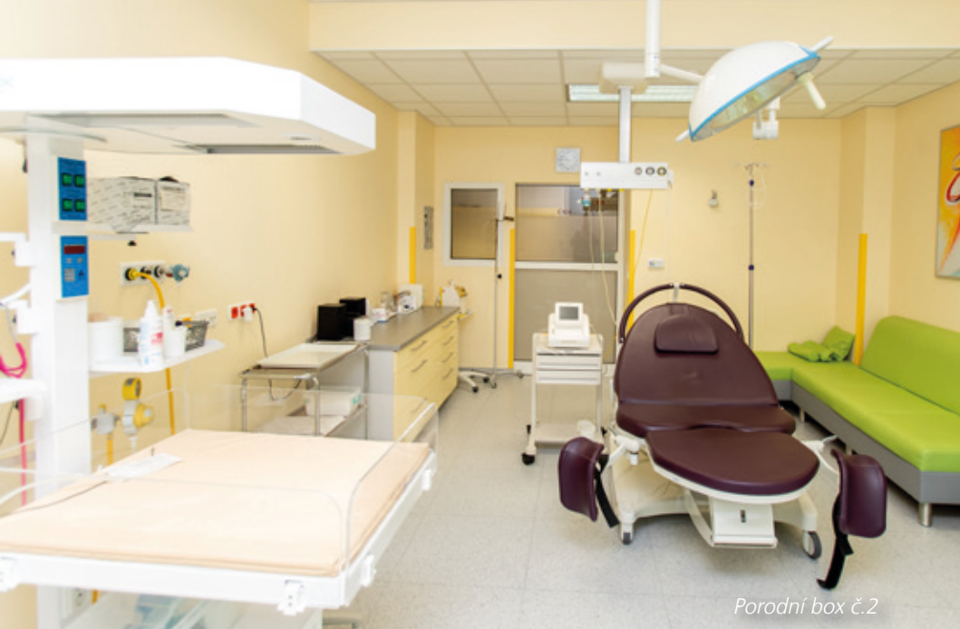
Porodní box č.2