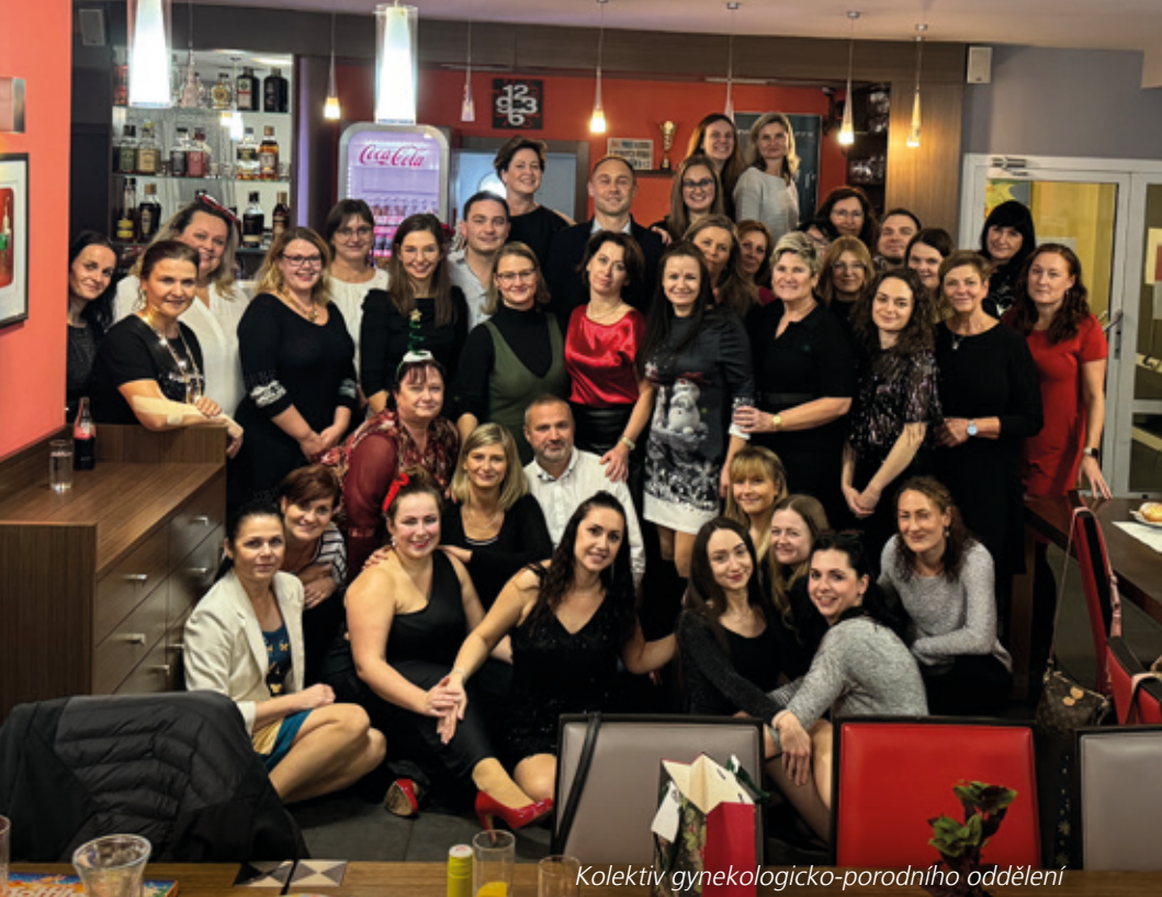
Kolektiv gynekologicko-porodního oddělení

Online objednávací portál https://e-health.msk.cz